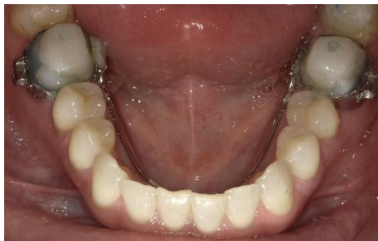
AGGA/ Flache Pads